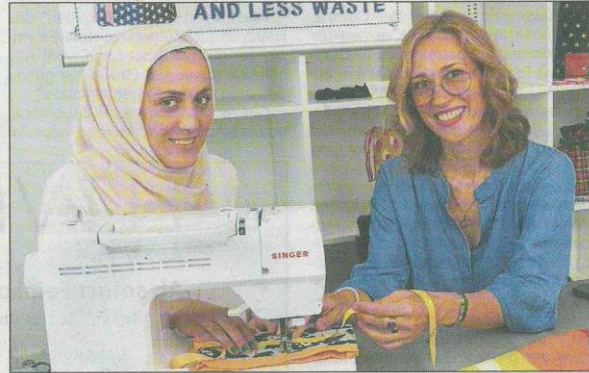
Zweimal wöchentlich wird bei der „Nähwerkstatt 4Freude“ genäht.

10. Dezember 2020, Rheingau Echo zur Nähwerkstatt 4Freude