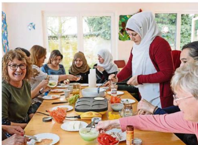
Gespräche bei kleinen Fladen und Dips: Bei den offenen Treffs im MGH Eltville lernen sich Menschen, wie hier beim gemeinsamen Essen beim Völkercafé, besser kennen.

Darüber hinaus stehen wieder Erste-Hilfe-Kurse für junge Eltern und, speziell für Senioren, der PC-Kurs „Junioren helfen Senioren“, eine Handysprechstunde, Seniorentanz, Babymassage, Beckenbodentraining, mehrere Spielkreise, Sportangebote, Flötenunterricht, ein Babysitterkurs für Jugendliche sowie die Babysittervermittlung, ein Literaturgesprächskreis und vieles mehr auf dem Programm.