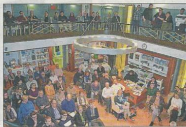
Die 29. Folge der Völkermühle dürfte einen Besucherrekord erreicht haben.

23. Januar 2020, Rheingau Echo zur Völkermühle am Rhein