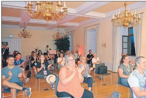
Das Publikum hatte sichtlich Freude am Bühnenprogramm.

17. September 2020, Rheingau Echo zum MasterPeace-Festival, Seite 1