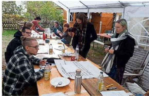
Der erste Workshop des Projekts „Mission: wir alle“ hat Ende Oktober begonnen.

Das Projekt geht von der Grundannahme aus, dass bei Jugendlichen ein Wissensmangel herrscht, was das Phänomen Rechtsextremismus ausmacht. An Schulen und Einrichtungen der offenen Jugendarbeit im gesamten Rheingau-