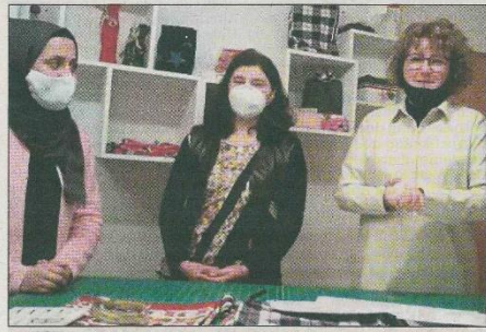
Der Sonderpreis, der von der Rheingauer Volksbank ausgegeben wurde, ging an das Team der Nähwerkstatt „4 Freude“.

der von der Gründungsfabrik Rheingau angebotenen Programme, um die Weiterentwicklung der Geschäftsideen zu potenzieren. Außerdem bekam das Gewinner-Team der ersten Kategorie „Beste Geschäftsidee in der Studienzeit“ kostenlos ein Büro mit Arbeitsplatz für die Dauer von drei Monaten in der Gründungsfabrik Rheingau. Die Bewerbungsfrist lief bis zum 1. November und bis dahin hatten sich dann auch sage und schreibe 31 Bewerber aus den beiden Hochschulen sowie aus dem Rheingau für den ersten Rheingauer Gründerpreis angemeldet. Aus diesem Kreis hatten es dann insgesamt neun Teams aus drei unterschiedlichen Kategorien ins Finale geschafft. Diese durften sich im Rahmen der Online-Veranstaltung am Mittwoch alle mit Kurz-Videos und in Live-Gesprächen mit den Moderatoren vorstellen, denn wer die Preisträger sein würden, das durften die Teilnehmer der digitalen Preisverleihung mitbestimmen. Alle Interessierten waren herzlich eingeladen, online mit abzu-