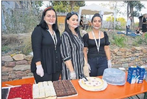
Familie Özbayrak hatte die Kuchenausgabe übernommen.

„Das Festival war aus meiner Sicht sehr gelungen. Viele lachende Gesichter auf zahlreichen Fotos zeigen