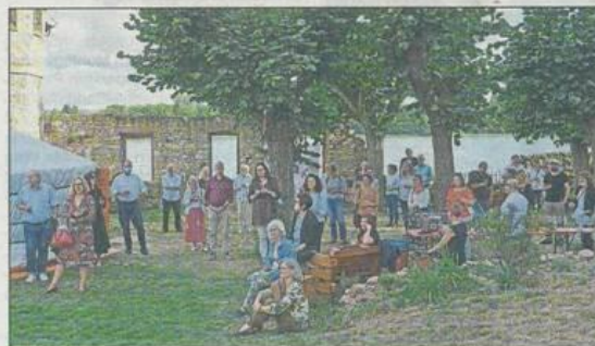
Die geladenen Gäste, die alle Teil des Netzwerks sind, feierten im Jugendpark der Kulturen das fünfjährige Bestehen der Philipp-Kraft-Stiftung.