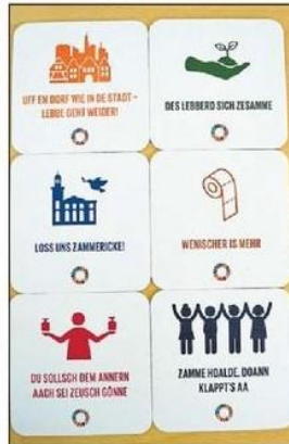
Alle 17 SDGs wurden in hessischer Mundart umschrieben und auf 85.000 Bierdeckel gedruckt. Hier eine Auswahl von sechs Sprüchen.

An der jeweils zuerst besuchten Station erhielten die Besucher eine Fairtrade-Startertasche mit Informationen,