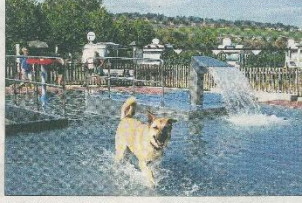
September: Das Kinderbadchen war auch bei den Hunden beliebt.