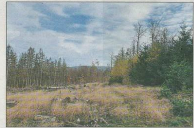
Der „Schulwald“ des Gymnasiums Eltville hat bisher symbolisch begonnen und soll an dieser Stelle mit größeren Pflanzaktionen im Frühjahr starten.

ersten 320 Ahornsetzlinge gepflanzt. Ein beeindruckendes Projekt mit langfristiger Perspektive“, betonte Zeltz. Weitere Informationen mit dem Video-Link findet man unter www.klasse-klima-rtk.org .