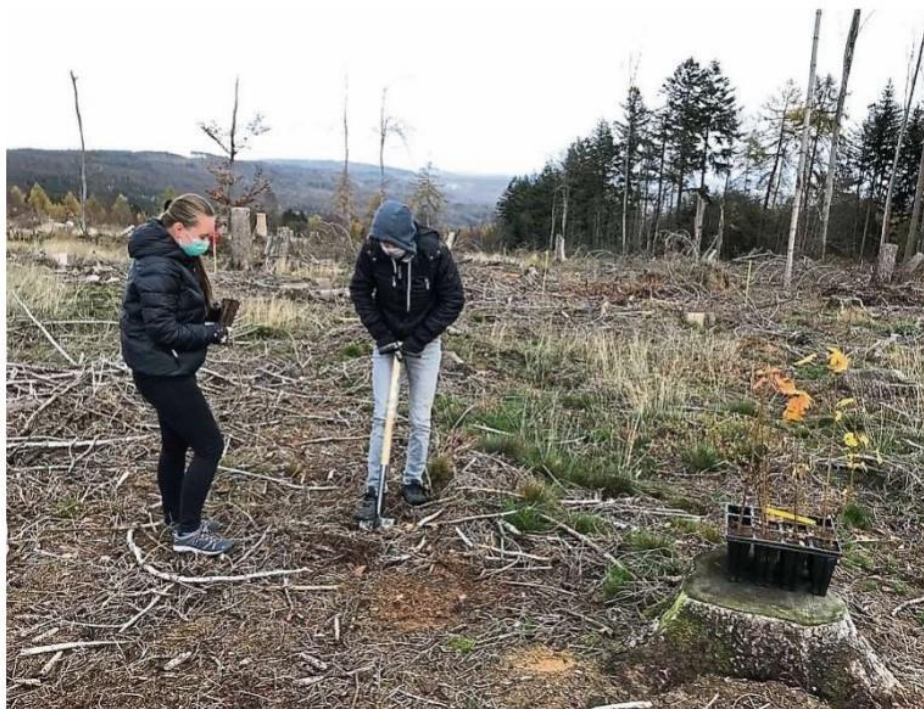
Schüler des Rheingaugymnasiums pflanzen auf der Hallgartener Zange neue Bäume.

Die Forschungen dazu, welche Baumart sich für welchen Standort eignet, seien in einem umfangreichen Werk zusammengetragen worden, so Dietz. Neben anderen Faktoren wie dem Ausgangsgestein, der Nährstoffversorgung der Böden und der örtlichen natürlichen Waldgesellschaft werde der Wasserversorgung der Waldböden besondere Aufmerksamkeit geschenkt. Bei den Modellrechnungen werde be-