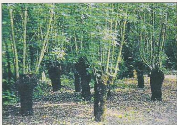
Kopfbäume bieten nachhaltig Brennholz, indem sie durch ständiges Beschneiden zum Wachstum von Zweigen angeregt werden (Foto aus dem Vortrag/Bildquelle „Les trognes“ von Gérard Mansion).

Sie nicht in Togo sind?“, fragte Ulrich Bachmann. „Ich vertraue meinen Partnern von ADICH und hoffe, dass ich in fünf Jahren dort nicht mehr gebraucht werde“, war ihre Antwort. Und am Ende erzählte sie noch die Geschichte vom Kolibri, der im Gegensatz zu den großen Tieren nicht wie gelähmt auf die brennenden Bäume starre. Der kleine Kolibri flog zum nächsten Fluss, nahm einen Tropfen Wasser in seinen Schnabel und ließ den Tropfen über dem Feuer fallen. Dann flog er zurück, nahm den nächsten Tropfen und so fort. Der Elefant mit seinem langen Rüssel, der viel mehr Wasser hätte tragen können, sagte zum Kolibri: „Was denkst du, was du mit deinem kleinen Schnabel tun kannst?“ Der Kolibri ließ sich nicht entmutigen und entgegnete: „Ich tue meinen Teil.“