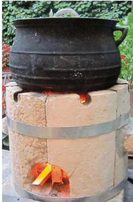
Ein moderner Lehmkocher, wie er sich in Togo preiswert an Ort und Stelle herstellen lässt.

Viel lieber berichtet Kloecker aber über positive Beispiele der Entwicklungshilfe. Das Stichwort lautet hier: Hilfe zur Selbsthilfe. Womit die 63-Jährige auch den Bogen zum Titel ihres Vortrags „Der Fisch und der Kolibri“ schlägt. Schließlich gebe es die