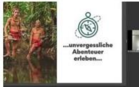
TriplLegend: Abenteuer und Nachhaltigkeit beim Reisen will dieser Gewinner miteinander verbinden.