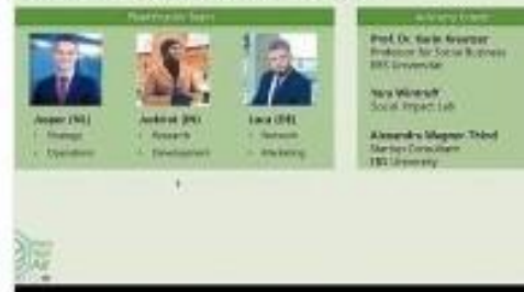
Plant your Air: Ein internationales dreiköpfiges Team will für gesunde Luft bei der Arbeit sorgen und belegte einen ersten Platz.

11. Dezember 2020, Wiesbadener Kurier zum Rheingauer Gründungspreis Nähwerkstatt 4Freude