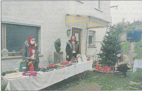
Erstmals gab es die Möglichkeit Nähprodukte der „Nähwerkstatt 4Freude“ im Rahmen eines Adventsverkaufs zu erwerben.