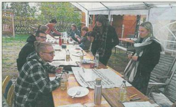
Die Aufnahme entstand beim ersten Workshop im Oktober.

Leiter des Projektes ist der Soziologe Vatan Akyüz mit den Schwerpunkten Migration, soziale Ungleichheit und empirisches Forschen. Seit Anfang 2019 ist er Verantwortlicher des interkulturellen Jugendtreffs im Jugendpark der Kulturen Eltville.