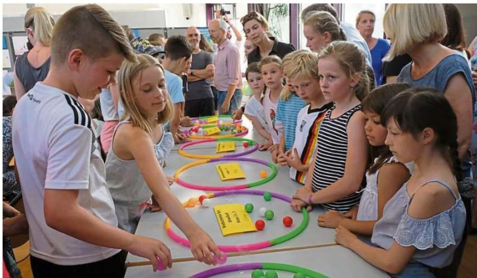
Im vergangenen Jahr wählten Schüler die Preisträger des Wettbewerbs in einer Präsenzveranstaltung. In diesem Jahr fand die Preisverleihung nur virtuell statt.

Zu Gewinnern kürte die zehnköpfige Jury schließlich zwei Projekte mit ähnlichen Zielen: Es geht um die Aufforstung von Waldflächen, die dem Borkenkäfer zum Opfer gefallen sind. Während die Schüler des Biologie-Leistungskurses an der Rheingauschule bereits Mitte November etwa 350 Ahorn-Setzlinge auf der Hallgarter Zange gepflanzt haben, ist die Pflanzaktion im „Schulwald Eltville“ auf das Frühjahr verschoben. Dort sollen mittelfristig 6000 Bäume gepflanzt werden. Um die nötigen finanziellen