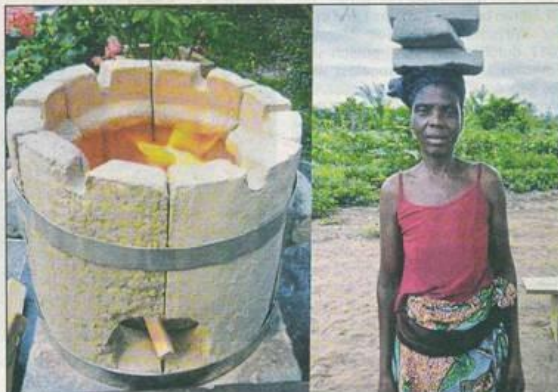
Ein Bild aus dem Vortrag: Frauen bauen Lehmkocher, die sie selbst nutzen und auch verkaufen können.

schen Organisation ADICH, die auch am Agrarprojekt EFIDO mitwirkt. In Zusammenarbeit zwischen LHL und den Partnern von ADICH wurde dafür ein Agrarzentrum zehn Kilometer nördlich von Atakpamé aufgebaut.